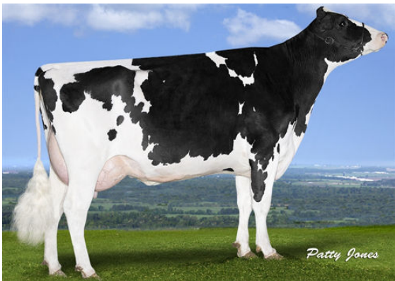
PROGENESIS ENFORCER PAT THIRD DAM