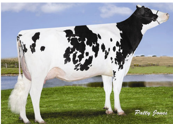
RUSSELLWAY CAMERON PINKY FOURTH DAM